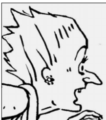
Adèle, vieille dame craintive, le genre à regarder s'il n'y a pas un cambrioleur sous son lit.