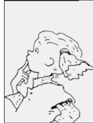
Amélie, petite fille de 4 ans.